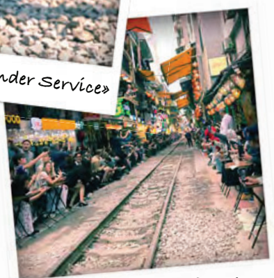
«Kurz vor Einfahrt»