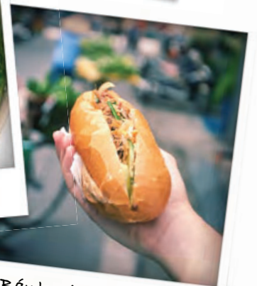
«Bánh Mì Sandwich»

Sich gegen Fremdherrschaft zur Wehr zu setzen, ist in der Geschichte Vietnams immer wieder Thema. 1.000 Jahre war das Land unter chinesischer Herrschaft; dreimal versuchten die Mongolen im 13. Jahrhundert, Vietnam zu erobern. Im 19. Jahrhundert kam dann Napoleon III. und gründete Französisch-Indochina. Auf das Ende der Kolonialzeit folgte der Krieg mit den US-Amerikanern, und anschließend versuchten die Chinesen erneut ihr Glück – mussten sich aber Ende der 1980er-Jahre geschlagen geben.