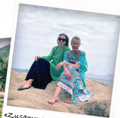
«Zusammen auf dem Felsen»